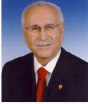
Mehmet ŞANDIR 21,24.ve 25.Dönem Hatay- Mersin Milletvekili