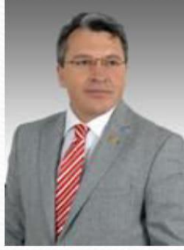
Feramuz ÜSTÜN Yönetim Kurulu Üyesi 24.Dönem Gümüşhane Milletvekili