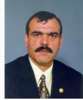
Armağan YILMAZ 21.Dönem Uşak Milletvekili