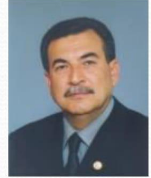
Mustafa HAYKIR 21.Dönem Kırşehir Milletvekili