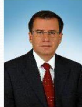
Dr. Hasan ÇALIŞ 21-23..Dönem Karaman Milletvekili